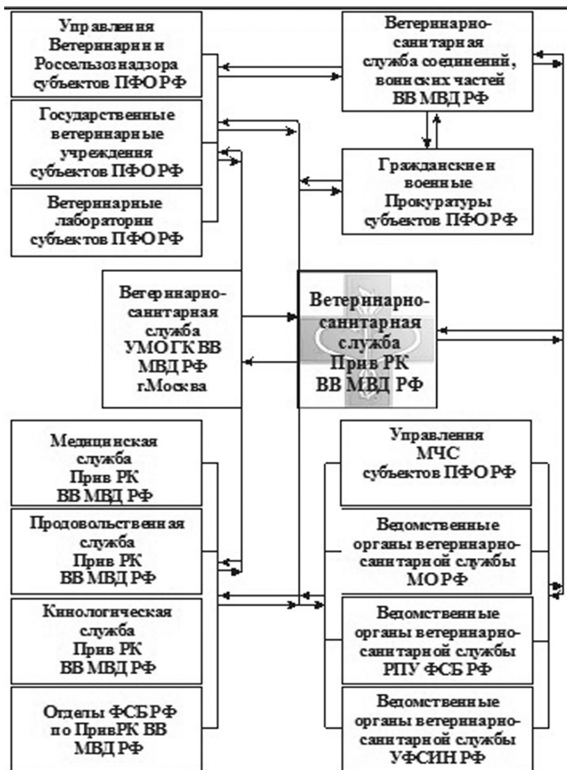
Рис. 2. Схема взаимодействия государственной и ведомственной вет. службы РФ