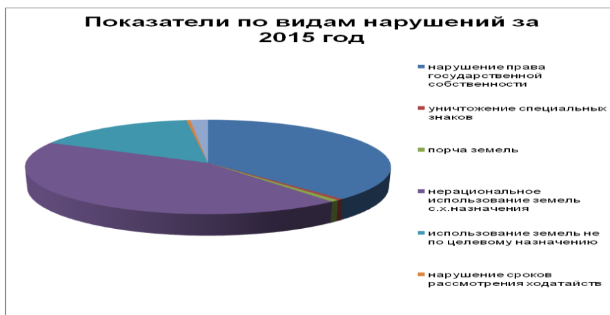
Рисунок 1. Показатели по видам нарушений за 2015 год

показал, что как по общему количеству проверок, так и по всем видам нарушений по сравнению с прошлым периодом показатели контроля значительно уменьшились.